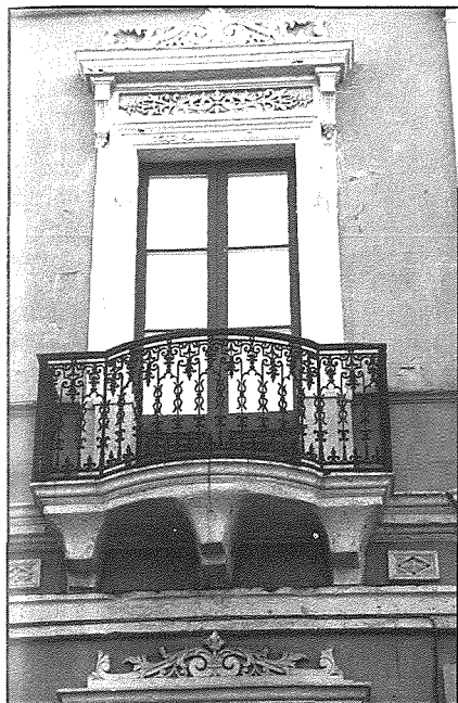
Il-lavur fil-gebla Maltija u d-disinn fl-injam u l-badid huma dawk il-gawbar frott is-snaġġa ta' missirijietna li qiegħdin iżejnu lid-djar antiki ta' l-bliet u l-irbula.

l-attenzjoni għall-ghadd numeruż ta' gallariji ta' l-injam li jinsabu fiż-żewġ naħat tagħha. F'din it-triq ewlenija Mostija nsibu xejn inqas minn 72 gallerija. Ohrajn jinsabu mferrxin fl-aktar postijiet qodma tal-Mosta fejn it-turist mitluf iserrep fit-triqat doġoq, jitghaxxaq bil-bini baxx qisu tal-hrejjef. U xi ngħidu għan-nieċ li naraw fil-faċċata ta' dawn id-djar? Fil-Mosta n-nieċ ma jonqsux. Bosta minnhom huma antiki ferm, waqt li ohrajn mhumiex daqstant qodma. Fuq kollox niltaqgħu ma' żewġ nieċ li huma uniċi fil-gżejjer tagħna. Dawn huma ta' San Angeliku martri Karmelitan u ta' Santa Barbara. Wiehed ta' min josserva n-numru ta' djar antiki li qiegħdin jinghataw isem u b'hekk tinholoq ċertu identità għal kull wahda minnhom.