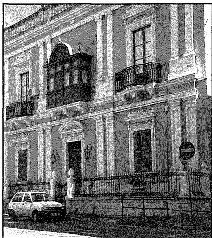
Il-faċċata eleganti ta' Villa Amadeo jew "l-Ghassa l-Qadima"

din il-binja arkitettonika li haslet waqgħet taħt l-għarbiel għarrixi tagħna.