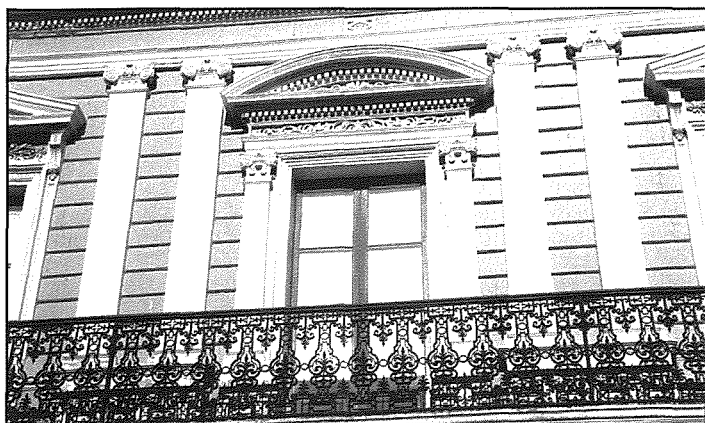
Il-gallerija twila tal-badid li tiddomina l-faċċata ta' din il-Villa minn naba ta' Triq il-Kungress Ewkaristiku.

din il-binja arkitettonika li haslet waqgħet taħt l-għarbiel għarrixi tagħna.