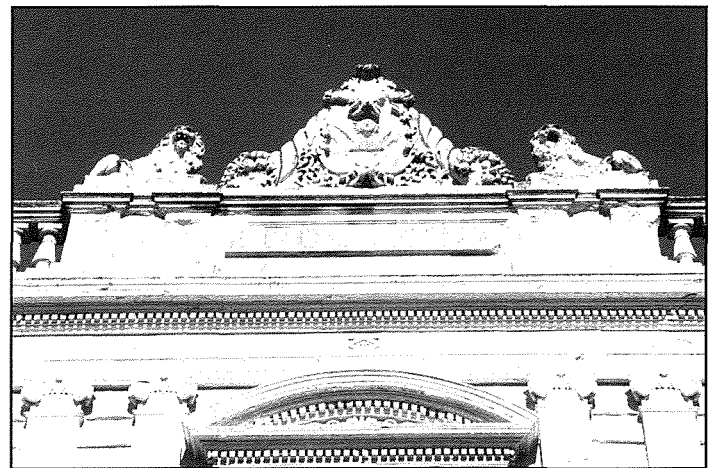
L-arma tal-gebel bi skultura mill-isbab, tinsab tinkumina l-quċċata tal-faċċata minn naba ta' Triq il-Kungress Ewkaristiku. L-irjeh u d-dbaben tal-karozzi jidbru li għamlu hafna hsara l-aktar fiż-żewġ iljuni tal-ġnub tagħha.