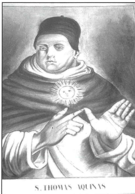
Xogħol ieħor bil-karbonella ta' Dun Karm - 'San Tumas Aquinas'.