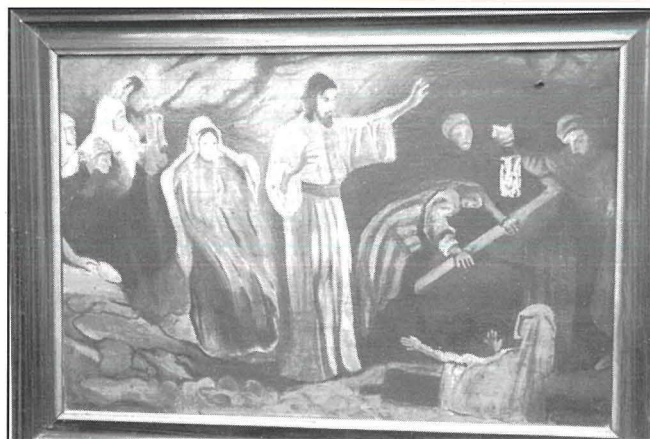
Pittura biż-żejt - xogħol Dun Karm Mifsud - jisimha 'Ġesù jqajjem Lazzru mill-Mewt'.