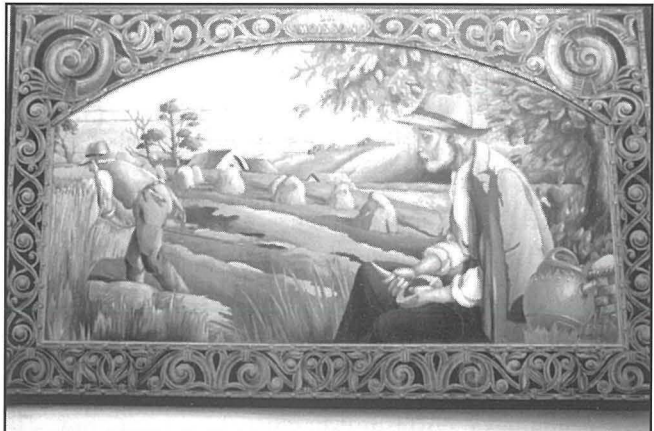
Kwadru ieħor maħdum bl-istess teknika bl-isem ta' 'Il-Hassada'.