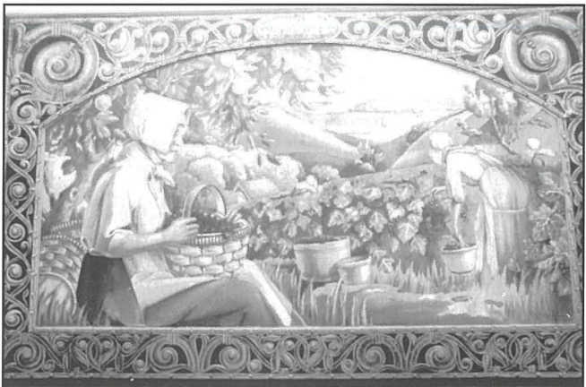
Ir-raba' kwadru tassew sabiħ maħdum bl-istess teknika tal-'Poacheur' u jismu 'Il-Qtuġħ ta' I-Gheneb'.