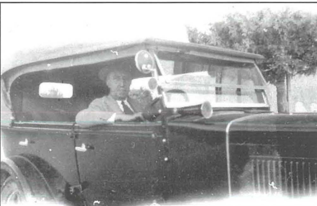
It-Tabib Rosario Mizzi jippoża fil-karozza tiegħu.