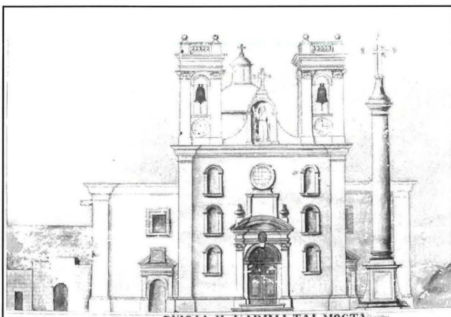
Il-knisja parrokkjali l-qadima tal-Mosta mibnija fuq id-disinn ta' Tumas Dingli.

Bla dubju, l-ispejjeż kienu kbar biex f'perjodu ta' aktar minn kwart ta' seklu titlesta l-knisja. Kien jehtieg sagrificiċju kbir. Il-festa ta' l-Assunta kienet tinzamm bl-inqas spejjeż possibli tant li r-registri tal- Veneranda