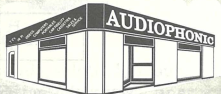
PHOTO COPYING HI FI COMPUTERS COLOUR TV's PORTABLES CAR FIDELITY CASSETTES