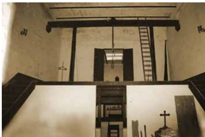
Il-Forka ġewwa l-Ħabs ta' Kordin

minn sensih. Wara li kienu għamlu tfittxija fil-ġnien sabu lill-Kappillan mejjet fil-bir. Sintendi kienu arrestaw lis-Sagristan u akkużawh bil-qtil tiegħu. Wara li nstemgħet il-kawża, (dak iż-żmien ma kienx għad hemm il-ġuri), qatgħuhielu għall-mewt u għalquh fl-inħawi tal-Knisja tal-Mirakli. Lill-Kappillan kienu difnuh fil-knisja parrokkjali fuq in-naħa tax-xellug, fil-kappellun u lis-Sagristan difnuh f'ħofra li kienu jgħaffru qabel it-tgħalliq hdejn fejn tkun saret il-forka.