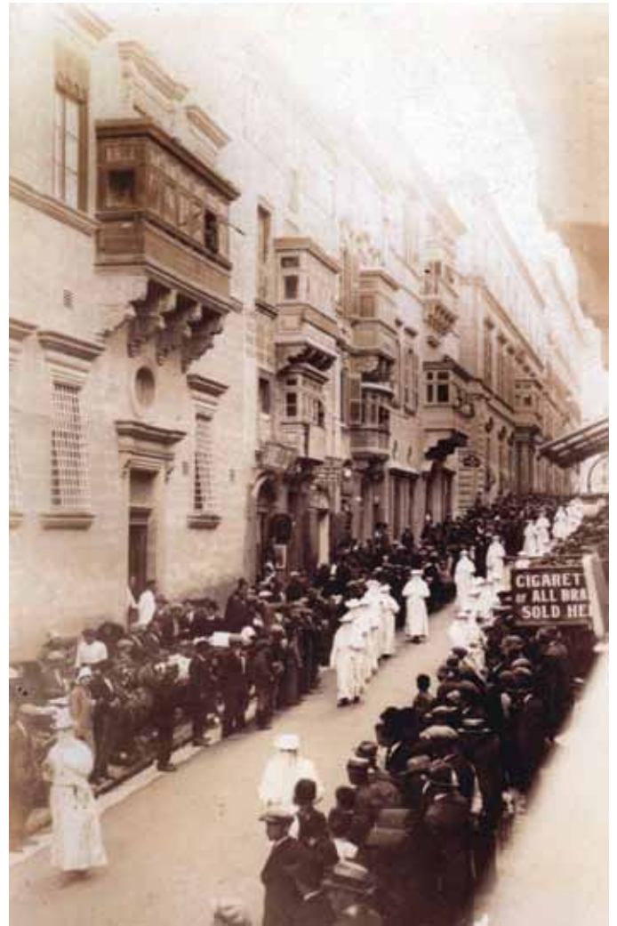
Il-Fratellanza tar-Rużarjanti għaddejin proċessjonalment jakkumpanjaw lill-ikkundannat, mill-ħabs fil-belt għal fuq il-forka fil-Furjana.

Id-difna kienet issir f'ħofra. Dan kien isir għax l-iġġustizzjat mhux biss ma setax jindifen f'art sagra, imma kellu jindifen f'post mhux magħruf. Il-katavru tiegħu kien jittieħed u jitniżżel mir-Rużarjanti f'din il-ħofra li kienet tithaffer viċin il-forka. Wara kienet titgħatta bl-istess ħamrija u materjal li jkun it-tella' mingħajr ma jsir l-ebda indikazzjoni ta' qabar. Dan id-dfin kien isir ġewwa Blata l-Bajda, fejn illum hemm il-Kappella tas-Socjetà tal-Mużew. Hemmhekk kien sar tista' tgħid iċ-ċimiterju tal-imgħallqin.