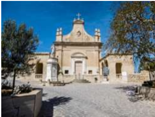
Il-knisja tal-Madonna magħrufa bħala "Santa Marija tal-Ħlas" tinsab f'Wied is-Sewda bejn Ħal

Qormi u Ħaż-Żebbuġ. Għalkemm hi aktar viċin Ħaż-Żebbuġ, din il-knisja minn dejjem kienet tagħmel ma' Ħal Qormi.