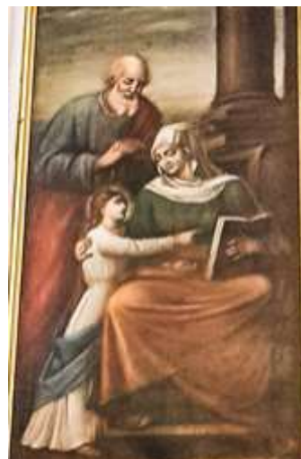
Madonna, Sant' Anna u San Ġwakkin