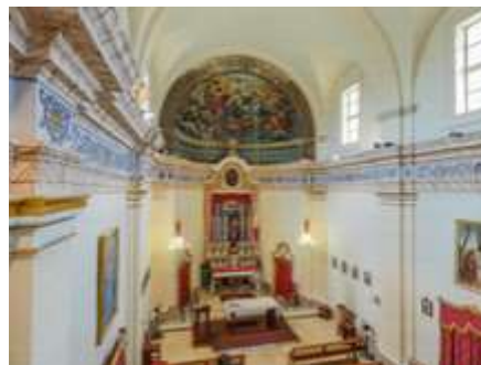
Dehra tal-artal ewlieni u l-apside mill-gallarja

F'Gjunju 2008 sar xogħol ta' restawr fuq il-faċċata kif ukoll tal-loġoġ. Kif ukoll ta' l-istatwa ta' Santa Marija li hemm quddiem l-knisja.