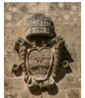
L-arma tal-Papa Klement XI

Bejn l-aħħar tas-seklu 17 u nofs is-seklu 18 sar l-akbar tibdil f'din il-knisja. Mill-viżta ta' Monsinjur Cocco Palmieri fl-1693, jidher li l-knisja nbnet mill-ġdid fuq l-pjanta ta' Lorenzo Gafa minħabba li ġarrbet ħsara kbira fit-terrimot li kien inħass f'Jannar 1693. B'dan it-tibdil, il-knisja tkabbret fuq wara fejn illum insibu l-kampnar. Il-kapillan ta' Ħal Qormi kiteb Ruma u kien qal li l-poplu Qormi kien lest li jħallas għall-ispejjeż, sakemm din tibqa' tagħmel mal-paroċċa ta' Ħal Qormi. Il-permess ingħata u għalhekk mal-faċċata tidher l-arma tal-Papa