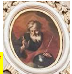
Il-Missier Etern—sopra kwadru fuq it-titular