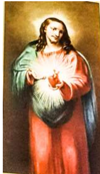
Qalb ta' Ġesu

ċentrali tagħti għat-tond li fuqha kellha titla' koppla. Il-presbiterju, li ġej għan-nofs tond bl-artal maġġur tal-irħam.