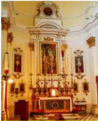
Dehra tal-artal ewlieni

Ġewwa hi mibnija bi stil Barokk bil-kolonni stil Korintin. In-navi huma msaqqfha nofs tond. Il-parti