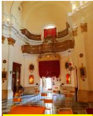
Bieb ewlieni u gallarija

ċentrali tagħti għat-tond li fuqha kellha titla' koppla. Il-presbiterju, li ġej għan-nofs tond bl-artal maġġur tal-irħam.