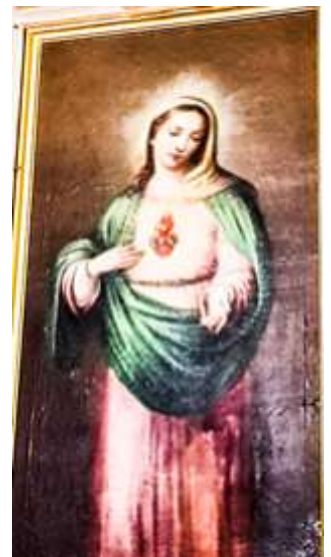
Qalb ta' Marija