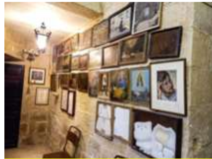
kwadri tal-wegħdi jew ex-voto