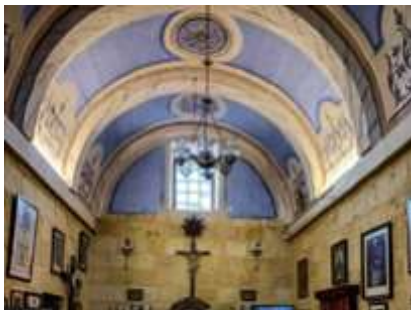
Is-saqaf tal-kappella oriġinali

L-art magħrufa bħala Tal-Ħlas ħadet isimha minn din il-knisja ddedikata lill- Madonna della Liberazione , kif kienu jsejthulha t-Taljani.