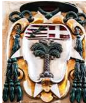
L-arma ta' Fra Montgaurdi

Madonna, iddeċieda li jibni l-knisja mill-ġdid. Bena wkoll kamra għar-rettur fil-ġnejna li hemm fil-qrib. Montgaurdi ukoll ħallas għall-kwadru l-qadim li juri l-Madonna fuq is-sħab u fil-ġnub, lil San Pawl, patrun ta' Malta u San Ġwann il-Battista, patrun tal-Ordni, bl-arma tiegħu isfel nett, u d-data 1573 li turi meta sar il