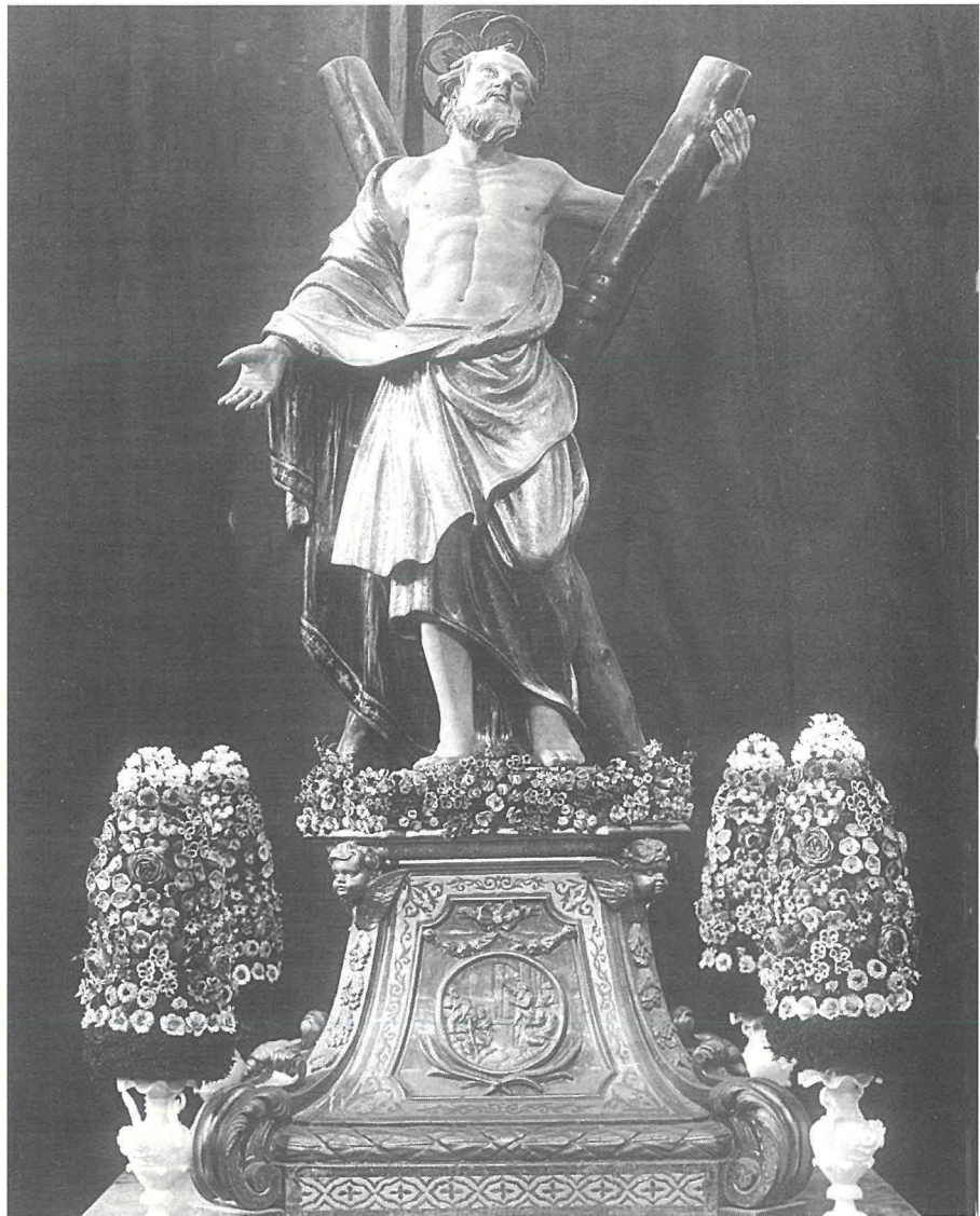
L-uniku dokument li għandna li juri kif kienet l-istatwa qabel ir-restawr ta' l-1913