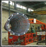
Vibro Pile Elements