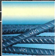
Cold Drawn Steel