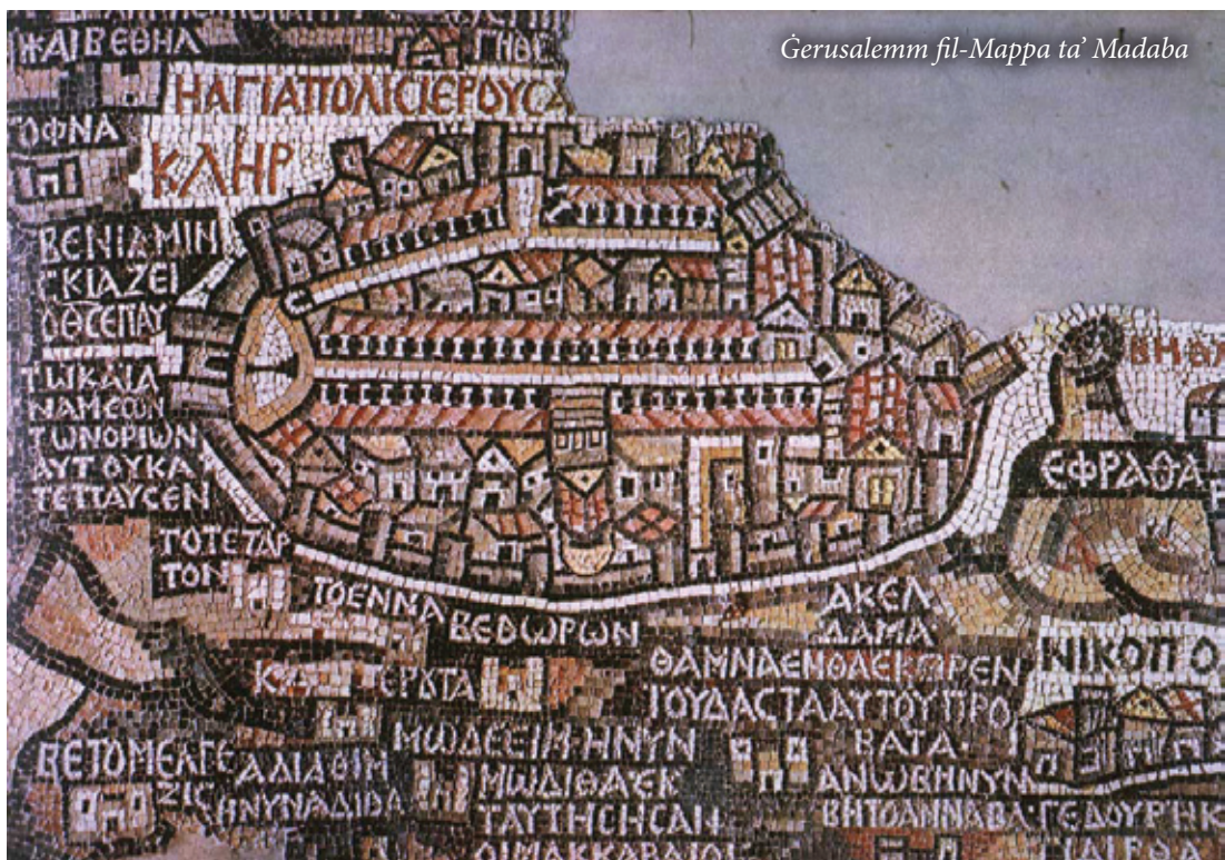
Ġerusalem fil-Mappa ta' Madaba

Mument iehor importanti ta' bini ta' knejjes fil-perjodu tal-hakma Bizantina kien dak ta' żmien l-Imperatrici