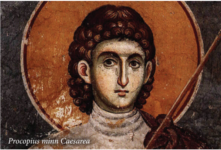
Procopius minn Caesarea

tal-Knisja tidher li tistrieħ fuq pedamenti li jinżlu fil-fond fil-blat, billi fuq din in-naħa hemm diżlivell qawwi tal-għolja tal-punent li fuqha kienet mibnija l-Knisja ta' Ġustinjanu. Jidher ċar li hemm differenza bejn il-gebel tal-Knisja nnifisha u dak tal-pedamenti ta' taħtha. Il-knaten tal-Knisja huma akbar, aktar maħdumin u imponenti. Jidher li din iż-żona li toħroġ barra mis-swar kienet l-abside tan-nofsinhar tan- Nea Theotókos . Irridu niftakru li s-swar tal-belt kif narawhom illum inbnew fil-bidu tas-seklu 16, u għalhekk għattew u għaddew minn fuq fdalijiet aktar antiki, bħal fil-każ li qed insemmu. Il-ħajt tan-nofsinhar tal-Knisja kien mibni biex miegħu iserrah diversi binjiet oħrajn, li instabu l-pedamenti tagħhom, fosthom xi ospizji li Procopios jgħidilna li Ġustinjanu kien bena mal-Knisja. Dawn l-ospizji kellhom l-iskop li jilqgħu