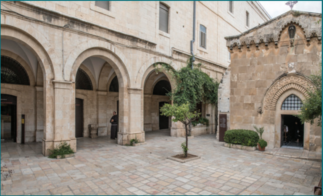
Studium Biblicum Franciscanum