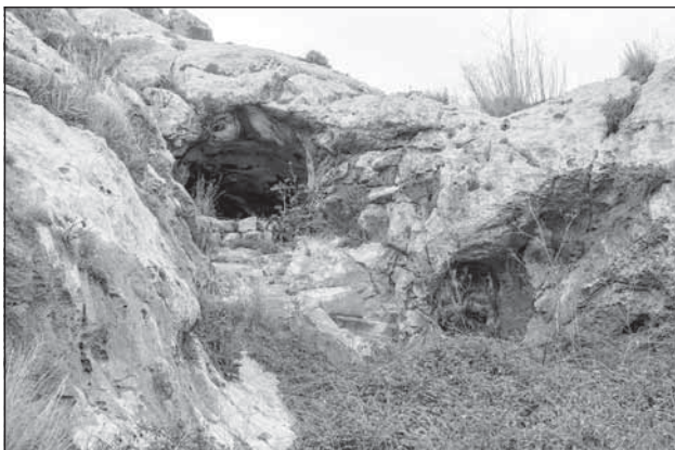
L-Għar ta' Wied Ħallelin.

Bħalma digà għidt, fl-inħawi ta' Bubaqra hemm għadd gmielu ta' widien, fosthom Wied Ganu, Wied