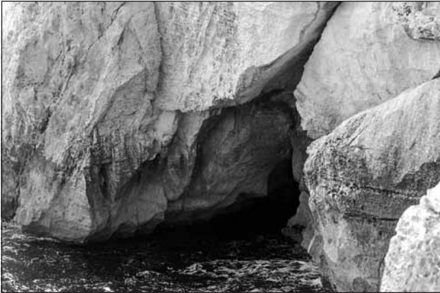
L-Għar ta' l-Għassa.

malajr, u meta waqgħet u ħabtet mal-ilma, kwantità kbira ta' tyres ħargu mill-vettura. Ħadna ħafna pjaċir b'din l-avventura u domna ħafna nitkellmu fuq din l-esperjenza għal ħafna żmien.