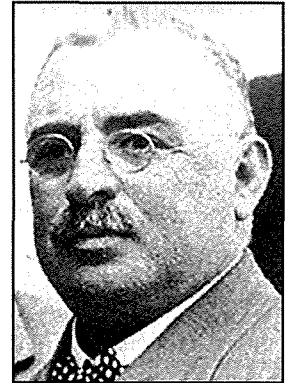
Sir Temi Zammit