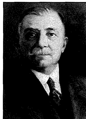
Il-Prim Ministru Joseph Howard

mogħti mill-gvern mill-Qorti ta' l-Appell jgħaddi, biex il-patrijiet ikunu jistgħu jkomplu bix-xoghol tal-knisja. B'sitt voti favur u wiehed kontra, il-kumitat ippropona li kien lest jissottometti proġett lill-gvern u lill-patrijiet li bih il-Minuri Konventwali setgħu jibqgħu jkabbro l-knisja mingħajr ma jwaqqgħu l-faċċata nterna. Ir-riżoluzzjoni qalet ukoll 'in case an agreement as the