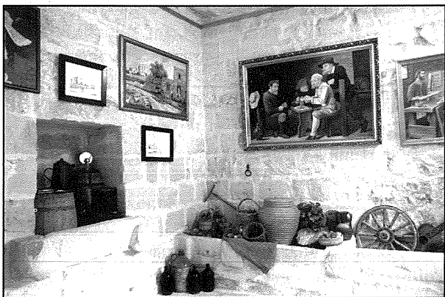
Parti mill-kwadri esebiti fir-Razzett tal-Markiz fejn juru t-talent ta' 'il-Budaj' fil-qasam tal-pittura.

ta' pittura u skultura, 'il-Budaj' dejjem ipprezenta xi biċċa xogħol ta' prestigju.