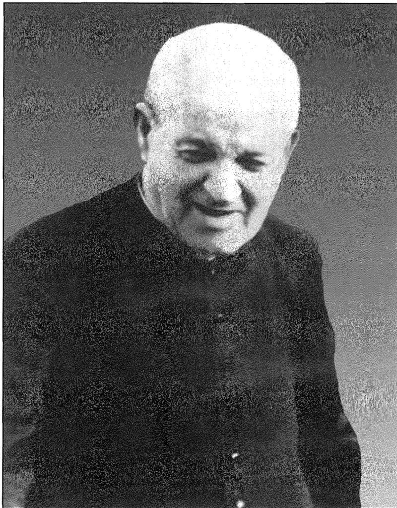
San Ġorġ Preca

Tul hajtu hadem hafna biex ixerred id-devozzjoni