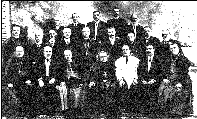
L-Eminenza Tiegħu l-Kardinal Francis Bourne, l-Arċisqof ta’ Westminster, li hadem kemm felah biex il-Kungress isir f’Malta.