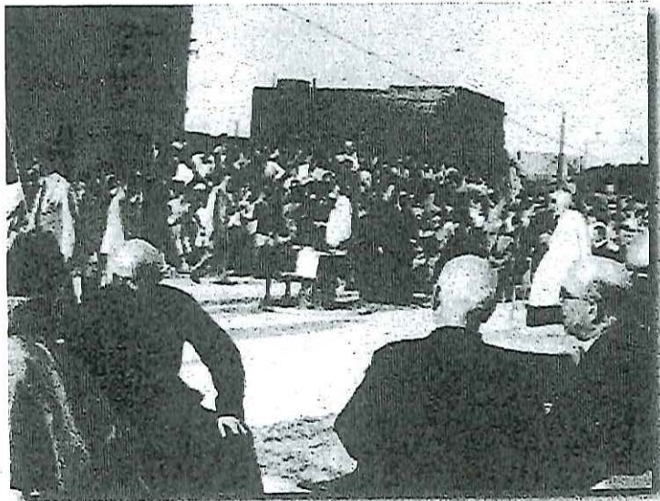
Fit-tberik ta' l-ewwel ġebbla tad-Dar Ġenerali 2 ta' Ottubru 1954

Fil-veru sens tal-kelma, Dun Ġorġ għex is-saċerdozju f'rabta qawwija mal-poplu. Dan huwa aspekk li tant narah jispikka fih. Wieħed minnkomb kiteb: "Lil Dun Ġorġ in-nies ħabbitu għax hu kien fehemha. Il-bniedem li jirnexxilu jsolvi l-konflitti interni ta' go fih qiegħed f'pożizzjoni li jifhem aħjar il-konflitti ta' l-oħrajn... Il-bniedem li jgawdi personalità sana u (li) aċċetta lilu nnifsu, iwieġeb b'mod realistiku ... (u) jadatta ruħu b'mod flessibbli" 1 .