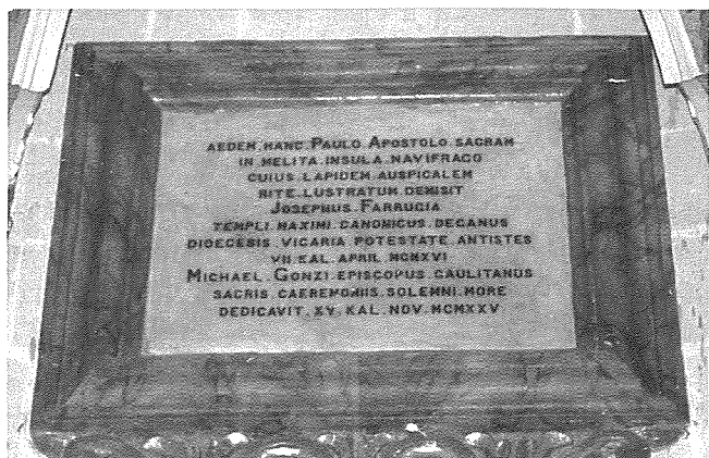
Wahda mill-ikrizzjonijiet tal-irham li hemm taht il-gallarija tal-Orgni.

Fl-14 ta' Frar 1928 il-pittur Robert Caruana Dingli thallas £30 tal-kwadru titolari ta' San Pawl. Għoxrin lira thallsu mill-benefatturi, waqt li l-għaxar liri oħra thallsu mill-knisja. Dan il-kwadru sar fis-sena ta' qabel, jigifieri fl-1927. Fi Frar ukoll inxtrat l-umbrella tal-vjatu minghand id-ditta Taljana Clemente Zappi, għall-prezz ta' £1.10s., inklużi l-ispejjeż tad-dazju. Mill-istess ditta nxtara wkoll drapp biex issir kapa: spiża ta' £2.