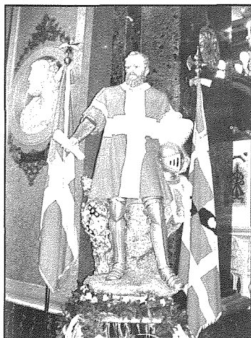
Il-Gran Mastru La Sengle

hadet sehem ukoll, flimkien ma' oħrajn, fil-Belt Valletta nhar l-4 ta' Ġunju biex jiġi ċelebrat ir-rebh tal-elezzjoni tal-Kunsill. U lejn l-aħhar tas-sena 1884 servizz importanti iehor għall-Filarmonika L'Unione kien dak għall-festa titolari ta' Sant'Andrija fl-1 ta' Diċembru 1884. Dakinhar kien ta' ferh doppju għall-poplu Halluqi, għax barra li kien qed jiċcelebra l-festa tal-Patrun, kien ukoll qed jifrah u jilqa' il-Kappillan il-għdid tiegħu.