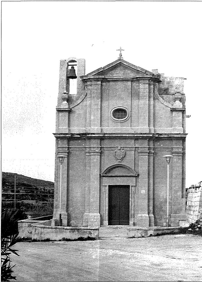
Knisja Bażilika tal-Madonna tal-Patroċinju tal-Għasri