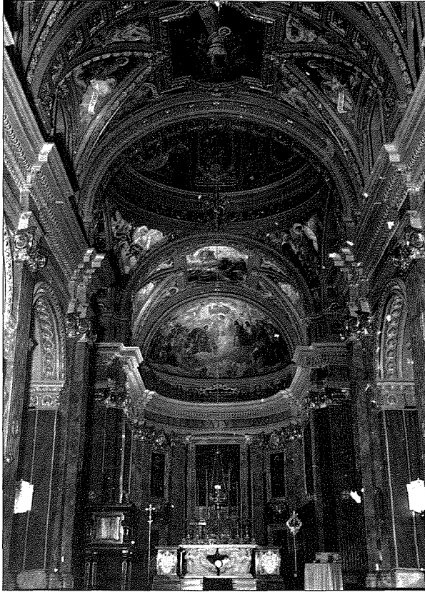
Il-Knisja Parrokkjali ta' San Ġorġ Martri tar-Rabat Għawdex

wieħed mill-ftit eżorċisti f'Għawdex, jekk mhux ukoll l-uniku! 17 "L-istess Dun Ġuzepp Schembri kien imur iqarar f'San Ġorġ u kif jgħidu kien ikun imsawwat mix-xitan, għax is-sagrigan kien jisma' s-swat neżlin fuqu u huwa kien jirrispondi: 'Niġi u nibqa' niġi'. (Kliem l-istoriku Għawdxi Mons. Luigi Vella [1859-1928])". 18