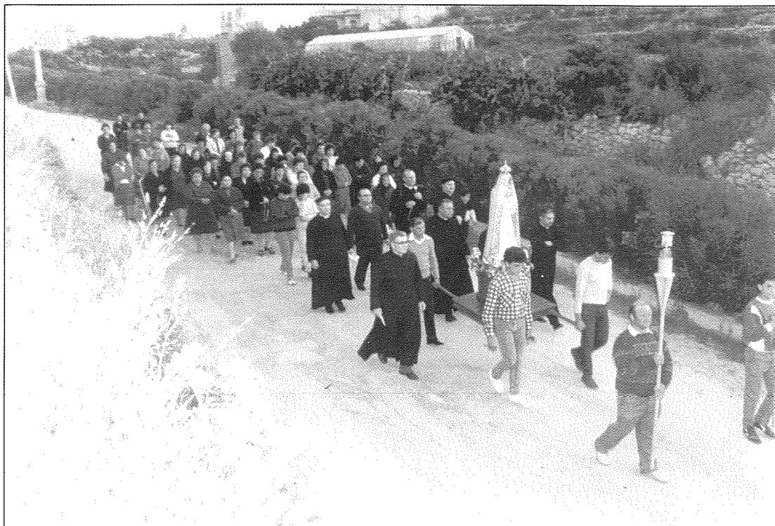
Għasri, 3 ta' Mejju 1989. Korteo bl-istatwa tal-Madonna ta' Fatima bil-parteciċipazzjoni tal-Kleru u l-poplu taż-Żebbuġ fl-okkażjoni ta' għeluq il-250 sena mit-tberik tal-Knisja tal-Patroċinju (08 Mej 1739), u l-200 anniversarju mill-Konsagrazzjoni tal-Bażilika (10 Mej 1789)