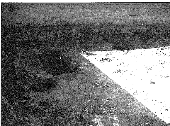
Is-sejba tal-erbgha t'ibjar misjuba fl-estensjoni taċ-ċimiterju

Ir-rappurtar tas-sejba qanqal interess partikolari fil-ġurnali lokali. F'Ġunju 2008 dehret ittra miktuba fuq il- Maltatoday fejn ġibdet l-attenzjoni tal-awtoritajiet fuq din is-sejba. Appellat biex il-bjar ikunu salvati. Xahar wara l-Alternattiva Demokratika harget stqarrija, bl-appell ewlieni ikunu dak li jiġi żgurati il-protezzjoni ta' dawn il-bjar. 15 Wiehed seta' jifhem iktar ir-relevanza ta' din is-sejba. Fil-fatt il-parroċca għamlet l-arranġamenti meħtieġa sabiex dawn il-bjar ma jiġux meqruda u jkunu parti integrali mill-estensjoni taċ-ċimiterju kif filfatti ġie deċiż iktar tard. 16