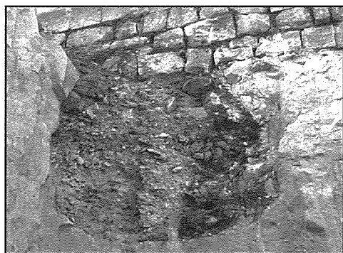
Bir li sfortunatament ġie parzjalment distrutt waqt ix-xogħlijiet ta' skavar

Il-profil ta' dan is-sit imur lura lejn Settembru tal-1956 meta C. Scicluna għamel rapport lid-Dipartiment tal-Mużewijiet, li fl-għalqa tieghu kien qieghed isib preżenza qawwija ta' għadam. 17 Fl-investigazzjonijiet li saru f'dawn l-akkwati instabu madwar sbatax-il bir arkejoġiġi li l-fond tagħhom ivarja minn 2.75m sa 4m. Ġie inutatt li dawk ta' qrib it-triq huma inqas fondi