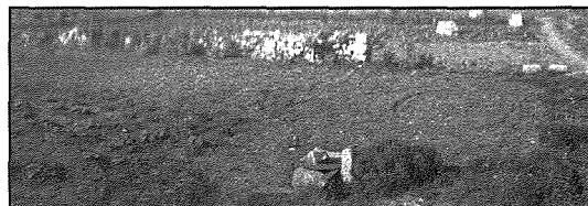
Bjar li jinstabu fis-sit arkejoloġiku fl-inhawi maghrufa f' Tal-Mejtin

f-rapport tal-Mużewjiet iġbid li nstabu ukoll ġarar li setgħu jiġu rrestawrati. Fl-ebbu nument ma jidher li nstab xi għadam ta' nies umani.