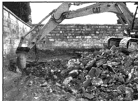
Ix-xogħlijiet fuq l-estensjoni taċ-ċimiterju parrokkjali

Tnejn minn dawn il-bjar arkejoloġiċi instabu permezz ta' toqba tonda fl-art. Iżda l-ikbar bir misjub, kien msaqqaf b'arkata fin-nofs. Preżentament, l-hoġor fejn kienet isserrah din l-arkata ghadhom