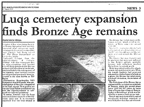
Wieħed mill-artikli li deher fuq il-gazzetta