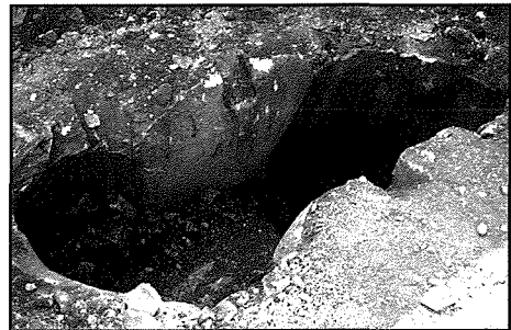
Tnejn mill-bjar misjuba fiċ-ċimiterju parrokkjali