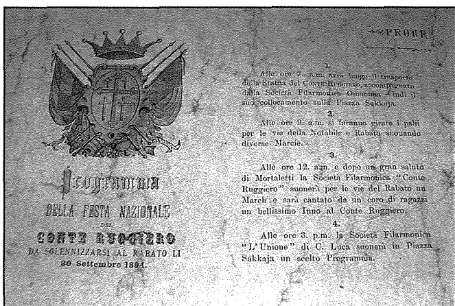
Astratt mill-programm tal-festa nazzjonali tal-Konti Ruġġieru fl-1894

Is-Socjetà Filarmonika L-Unjoni giet mistiedna mill-kumitat tad-direzzjoni sabiex iddoqq programm mużikali nhar il-Hadd 30 ta' Settembru fit-3.00 p.m. fl-izjed post prominenti tar-Rabat fuq panorama mill-isbah ta' Pjazza Saqqajja, f'laqgħa straordinarja tal-pubbliku ta' dik il-lejla festiva u storikament patrijottika. Dakinhar tal-festa, ċ-ċelebrazzjoni bdiet għas-7.00 ta' filgħodu meta l-Istatwa tal-Konti Ruġġieru giet mehuda mill-Kazin San Pawl għal Pjazza Saqqajja akkumpanjata mill-Banda Konti Ruġġieru li dik is-sena kienet taht il-presidenza tal-maghruf Baruni Ġermaniż Massimiliano Von Tücher (1893 - 1914).