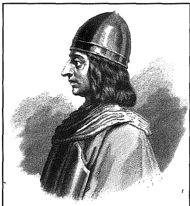
Inċiżjoni tal-Konti Ruġġieru

L-ideja dominanti ta' Chesterton u Belloc, żewġ kittieba prolifici Kattoliċi Ingliżi hi li ċ-ċivilta' u l-unità tal-Ewropa hi ċ-ċivilta' u l-unità Kattolika. Dawn iż-żewġ kittieba jostnu li sa ma qabel tfaċċat ir-Riforma Protestanta li hawdet l-Ewropa kollha, kull bniedem ċivili kien jgħożż din iċ-ċivilta' u din l-unità li minnha kien jiffirma parti bl-akbar dover ta' omoġenità kull pajjiż Ewropew, saħansitra anke Malta.