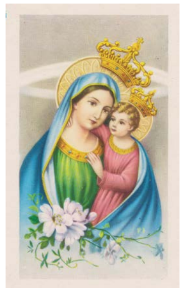
Santa sabiha bix-xbieħa tar-Reġina tal-Paċi

Reġina tal-Paċi – Marcia Religiosa: Il-partitura hija awtografata u ġġib id-data tal-10 ta' Mejju 1956 (lejlet jum għeluq sninu, u sena qabel ma' ddimetta minn surmast taż-żewġ baned, dik Ħamruniża u l-oħra Mellihija, minħabba raġunijiet ta' saħħa). Il-marċ inkiteb espressament għall-banda 'Leone' t'Għawdex u huwa ddedikat lill-Madonna bħala s-Sultana tal-Paċi. Għall-anqas mill-partitura, wieħed ma jistax jgħid jekk tal-innu reliġjuż kinux sarulu xi versi biex jitkanta, u jekk iva, ta' min huma. Jista' jkun li dan inkiteb apposta f'xi waħda mill-okkażjonijiet marbutin mal-għoti tal-istatwa ta' Sta Marija 'l-Katidral fl-istess sena. Infatti, fit-29 t'April, il-vara ta' Sta Marija kienet telqet mill-każin għal Pjazza Savina, u minn hemm għall-Katidral, akkumpanjata minn daqq t'innijiet Marjani. Aktar tard fl-istess jum, il-banda 'Leone' kienet nisġet programm vokali-strumentali fi Pjazza t-Tokk taħt id-direzzjoni ta' Mro Willie Attard. Jidher li ċ-