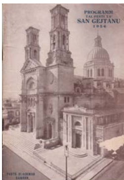
Il-famūza koppla 1956

Il-Famūza Koppla – Març Brijuż: Għad li dal-març m'għandu l-ebda bżonn t'introduzzjoni mad-dilettanti tal-festi u l-marçi, għax jinsab tista' tgħid għand kull banda li hawn fil-gżejjer Maltin, fl-2016 kont kiibt artiklu twil ħafna fil-ktieb tal-festa tal-banda Gużepina Hamruniża, pp.205-35, bl-isem ta' 'Il-Ġrajja tal-Famūza Koppla (60 Anniversarju)'. Dal-març kien ispirat direttament mid-diversi ġrajjet li għaddew minnhom il-Ħamruniżi li wasslu għall-bini tal-koppla tal-knisja parrokkjali tal-Ħamrun, li giet proprju