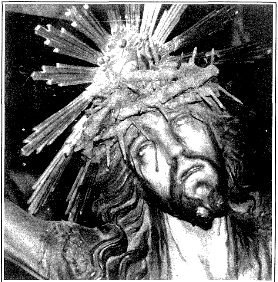
Il-Kurċifiss tal-Vara l-Kbira Meqjum fil-Parroċċa ta' San Lawrenz Vittoriosa

Il-purċissjoni kienet iddur mal-Birgu sa hdejn Sant' Anġlu, iddur hdejn il-baħar matul ix-xatt il-kbir. Kienet tieqaf fejn il-knejjes tal-Luzjata, ta' Santa Skolastika u tal-Karmnu. Il-Kleru, bil-Monument, kien jidhol f'dawn il-knejjes fejn ikantaw xi responsorju. Il-purċissjoni kienet issir fiddlam. Toħroġ fl-Ave Maria u tibqa' tard barra. Il-qassisin, il-fratelli u l-abbattini kien ikollhom lanterni jew torċi mixgħulin billi dak iż-żmien ma kienx hemm dawl ta' l-elettriku.