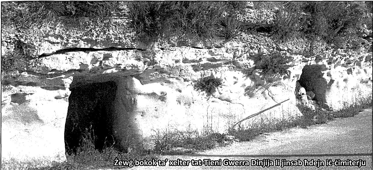
Żewġ bokok ta' xelter ta' Tieni Gwerra Dinjija li jinsab hdejn iċ-ċimiterju

xellug ukoll. Reċentement, meta kienet qeghda ssir ir-rikostruzzjoni tal-pjazza tar-raħal inkixfet il-bokka tan-naħa tax-xellug.