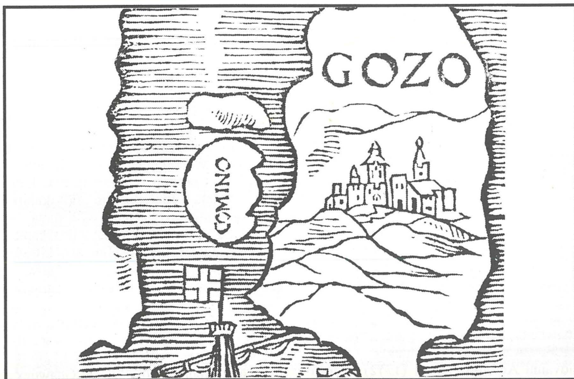
L-Imdina ta' Ghawdex fil-mappa ta' Jean Quentin D'Autun (1536)

tas-seklu dsatax meta bdiet tinbena t-Telgħa tal-Belt instabu numru ta' fosos forma ta' qanpiena tipiċi ta' dan iż-żmien, fosos li kienu jintużaw biex jinħażen il-qamh u l-ilma.