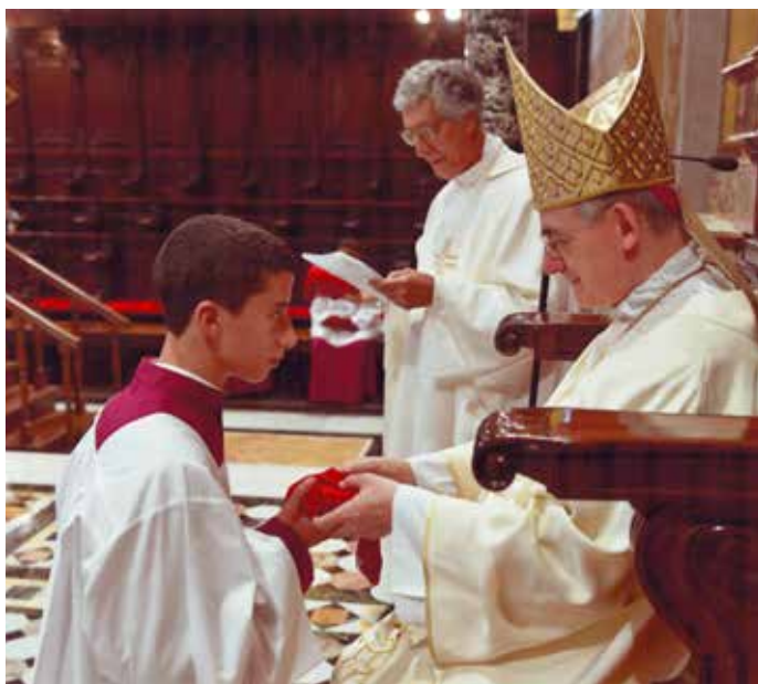
Jingħata l-faxxa mill-Isqof Lanzani fil-Vestizzjoni.

L-esperjenza tiegħi taf il-bidu tagħha f'Novembru tas-sena l-oħra, dakinhar tal-eżami. Kemm fraħt flimkien mal-familja tiegħi meta sirna nafu illi x-xewqa tiegħi li nkun abbati fil-Vatikan kienet ser issehh! Wara bosta laqgħat ta' preparazzjoni u thejjija fis-Seminarju Magguri, il-gurnata kienet waslet. Fit-13 ta' Awwissu 2019 kont fuq titjira diretta lejn Ruma, minn fejn erhejnielha lejn il-Belt tal-Vatikan. Għal ġimagħtejn shah qghadna fil-Preseminarju San Piju X, maġenb ir-Residenza ta' Santa Marta fejn joqgħod il-Papa Frangisku.