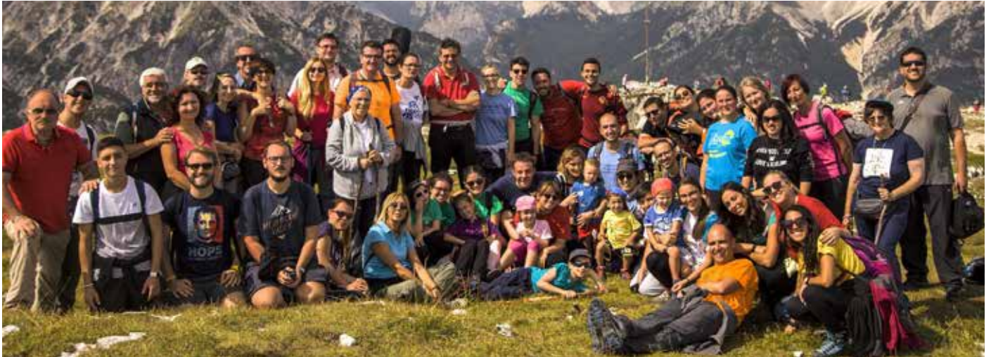
Il-Camping tal-Familji u ż-Żgħażaġh fl-2018.

Issa mill-1 ta' Settembru 2021 ser nibda esperjenza ġdida bħala Kappillan fil-Parroċċa tal-Wiċċ Imqaddes ta' Ġesù. Żgur li miegħi ser nieħu bagalja ta' esperjenzi sbieħ li ċert ser jgħinuni f'din l-avventura l-ġdida li ser nibda. Miegħi mhux ser nieħu biss l-esperjenza li għamilt f'dawn l-aħħar disa' snin, imma żgur li ser nieħu wkoll dak kollu li jiena rċevejt minn Għawdex tagħna u fuq kollox mill-Parroċċa ta' Ġorġi tagħna, li fiha rċevejt il-Fidi