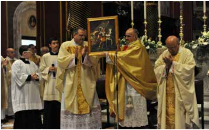
Il-Ġublew Saċerdotali tad-Deheb iċċelebrat fil-Bażilika ta' San Ġorġ.