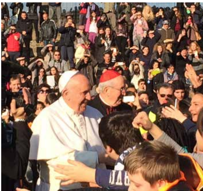
Il-Papa Franġisku jżur il-Parroċċa f'Marzu 2015.

F'din il-parroċċa aħna s-sacerdoti naħdmu id f'id flimkien ma' tliet kongregazzjonijiet ta' sorijiet (Salesjani, tal-Karità u ta' Madre Tereza), flimkien ma' għadd ta' assoċjazzjonijiet lajċi, sew li jaħdmu fl-intern tal-parroċċa u sew li jaħdmu fuq it-territorju ta' Tor Bella Monaca. Is-Sorijiet Salesjani kienu jieħdu ħsieb l-oratorju parrokkjali u jgħinu fil-katekezi tat-tfal u ż-żgħażaġħ, kif inhu l-istil li ħallielhom San Ġwann Bosco. Fuq kollox (dejjem fil-lokal tal-parroċċa) għandhom żewġ ċentri li fihom jilqgħu tfal