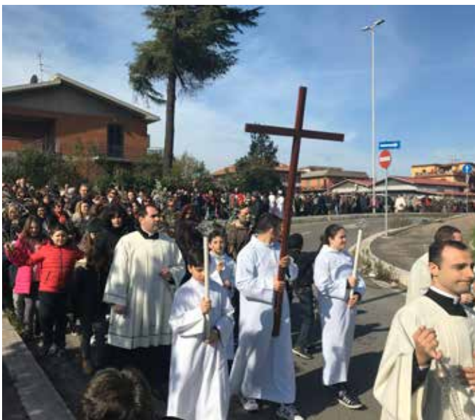
Purċissjoni ta' Hadd il-Palm.

Mument partikulari kien iż-Żjara Pastorali tal-Papa Franġisku fit-12 ta' Marzu 2015 fil-parroċċa tagħna. Din iż-żjara ma kinetx mistennija peress li din il-parroċċa kien diġà żarha l-Papa San Ġwanni Pawlu II fil-bidu tas-snin 80 meta kienet għadha kemm ġiet iddedikata l-knisja. Sirna nafu b'din iż-Żjara Pastorali f'xi Jannar 2015, għalhekk tistgħu timmaginaw ix-xogħol li ried isir biex nippreparaw. Kienet esperjenza sabiħa ferm, mhux biss il-miġja tal-Papa fiha nfisha, imma daqshekk ieħor importanti kienet il-preparazzjoni u l-entuzjażmu tan-nies fil-ġimgħat ta' qabel. Il-Papa ġie l-parroċċa fin-nofstanhar ta' filgħaxija, żjara qasira imma intensa fejn seta' jiltaqa' ma' kull kategorija, ibda mill-morda, anzjani u persuni b'diffikultà li ltaqa' magħhom fl-istruttura taċ-ċentru tal-Caritas. Imbagħad iltaqa' mat-tfal u ż-żgħażaġh fil-grawnd tal-parroċċa, fejn tlett itfal u żgħażaġh għamlulu xi domandi. Minn hemm iltaqa' ma' grupp żgħir ta' tfal li jgħixu diffikultajiet fil-familji tagħhom, u dritt wara fis-sala tat-teatru ltaqa' mal-Kunsill Pastorali u l-kollaboraturi parrokkjali. Mument ieħor sabiħ kien meta ltaqa' mal-familjari tagħna s-sacerdoti u dritt wara qarar tliet membri tal-komunità parrokkjali li xi jiem qabel tellajna bix-xorti. Il-qofol taż-żjara kienet il-quddiesa mal-komunità parrokkjali li kellha x-xorti tidhol fil-knisja u folla kbira ta' nies li segwiet mill-pjazza.