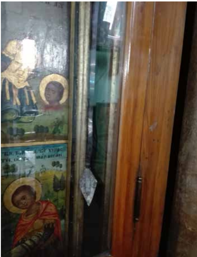
Il-Hanza ta' San Ġorġ.

Minn ġewwa l-knisja hi ddekorata b'affreski u ikoni fuq stil Bizantin. F'nofs il-koppla hemm il-figura ta' Kristu Pantokrator. Hemm rappreżentazzjonijiet ta' San Ġorġ fuq żiemel abjad u tal-martirju tal-qaddis, liebes tonka ħamra. Ma tonqosx l-ikona ta' San Ġorġ, meqjuma f'din il-knisja, flimkien mar-relika tal-katina li biha ġie marbut, li huma meqjumin dejjem, mhux biss mill-Kristjani Griegi-Ortodossi, imma saħansitra mill-Musulmani, l-aktar nhar il-festa ta' San Ġorġ Martri, li fil-Kalendarju Ġuljan segwit mill-Ortodossi hi ċċelebrata fis-6 ta' Mejju, li jikkorrispondi għat-23 ta' April tal-Kalendarju Gregorjan segwit minna l-Kattoliċi.