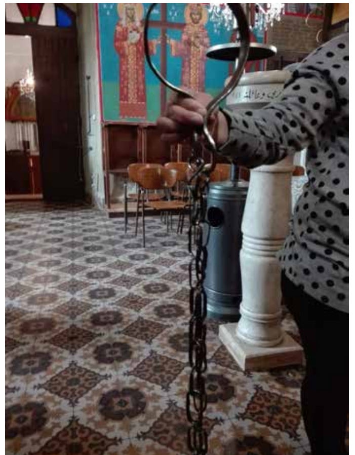
Il-Katina ta' San Ġorġ.

Fl-epoka Ottomana (1516-1917) Al Khader kien raġal li kien jiddependi mix-Xiħ (Sheik) ta' Bani Hasan, taħt it-tmexxija tal-Familja Al-Walaja. L-esploratur Inġliż Edward Robinson fl-1838 jgħid li l-abitanti tar-raġal kienu Musulmani. Fl-1870 il-fdalijiet tal-monasteru Grieg kienu qed jintużaw bħala kenn għall-morda mentali. Lejn tmieim is-seklu 19 il-Palestine Exploration Fund, fis- Survey of Western Palestine , iddeskriviet Al Khader bħala raġal kbir li fih knisja u kunvent Griegi, imdawwar minn dwieli u siġar taż-żebbuġ, u minn oqbra mħaffra fil-blat fuq ix-xaqliba tat-tramuntana. Kellu popolazzjoni mħallta ta' Musulmani u Griegi-Ortodossi.