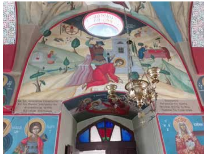
Raffigurazzjoni tal-Martirju ta' San Ġorġ.

Fl-era Kruċjata (1099-1291) dan ir-raġal kien jissejjaħ Casale Sancti Georgii . Kien ingħata minn Geoffrey de Tor bħala parti mill-proprjetà tal-Knisja tan-Natività f'Betlehem bejn l-1227 u l-1266. Fl-1421 il-vjaġġatur John Polner isemmi din il-Knisja ta' San Ġorġ bħala li tinsab fuq għolja qrib Betlehem.