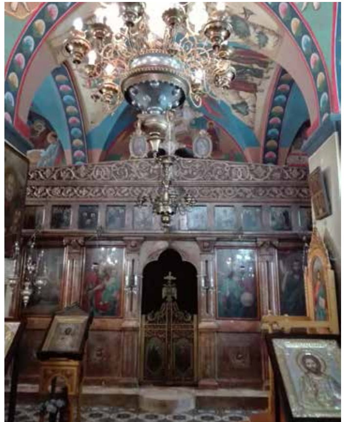
Il-Knisja ta' Al Khader minn ġew.

L-istudjuż Denys Pringle, f' The Churches of the Crusader Kingdom of Jerusalem: A Corpus , Volum 1 [A-K (Excluding Acre and Jerusalem)] (Cambridge University Press 1993,