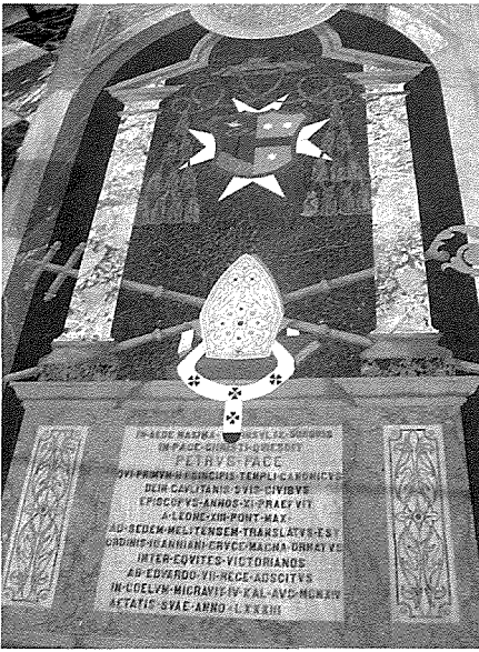
L-epitaff li hemm fil-Katidral tal-Imdina.

minsuga minn Mons. Giuseppe Farrugia, Vigarju Ġenerali. Wara din it-tislma solenni, l-Isqof Pace gie midfun fil-Kappella ta' San Ġuzepp fejn għadu jinsab sal-lum.