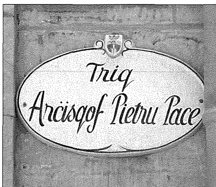
Il-plakka tat-triq li ġgib ismu fil-Belt Victoria.

Mons. Isqof Pace ħabrek biex in-nies ikunu aktar moqdija fil-bżonnijiet spiritwali tagħhom. Għalhekk huwa waqqaf diversi parroċċi, fosthom dik ta’ San Ġiljan (1891), ta’ Marsaxlokk (1897), tal-Imġarr (1898), tal-Kalkara (1898), ta’ Raħal Ġdid (1910), ta’ Birżebbuġa (1913), u tnejn oħra mogħtijin lill-patrijiet: dawn kienu