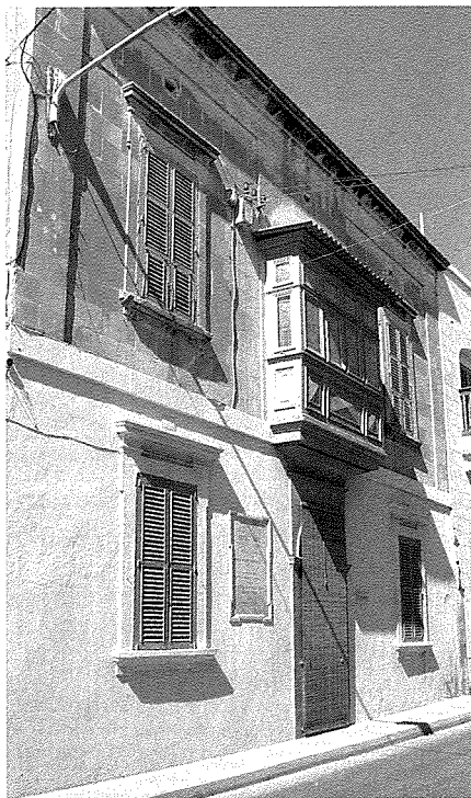
Il-faccata tad-dar fejn twieled wara San Frangisk, fejn, fil-fatt, hemm irhama li tfakkru.