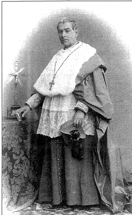
Ritratt uniku tal-Arcisqof Pace.

Fuq insistenza tiegħu mal-Gvern tal-ġurnata, ittiehdu l-passi meħtieġa biex inbeda servizz ta' trasport irħis u regolari bil-baħar bejn Malta u Għawdex li sa dak iż-żmien kien għadu ma jeżistix.