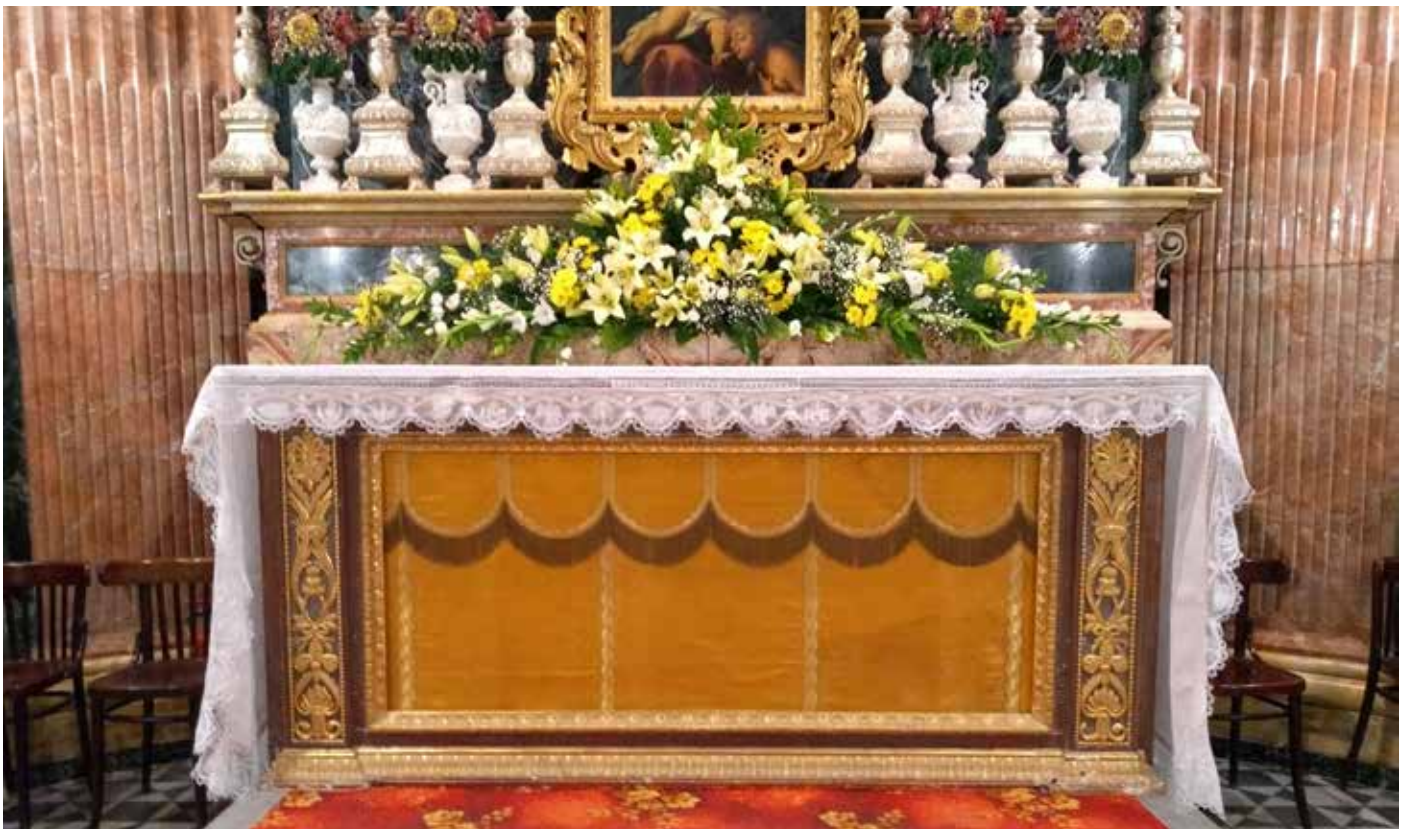
Il-bizzilla lesta lura mat-terħa ta' San Lazzru, Kwaranturi 2021.

l-'għaliex' madwar mitt sena ilu kienu jaħdmu b'dan il-mod l-antenati tagħna, u nitgħallmu minnhom għaliex għandna dejjem napprezzaw.