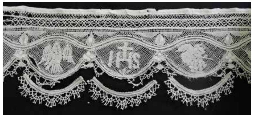
Il-bizzilla miftuħa qed tinxf.