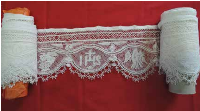
Id-differenza bejn bizzilla fi stat oriġinali (fuq) u bizzilla msewwija (isfel).