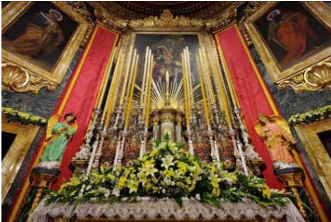
Il-bizzilla ta' San Lazzru armata fuq l-Altar tar-Ripożizzjoni, Hamis ix-Xirka 2021.