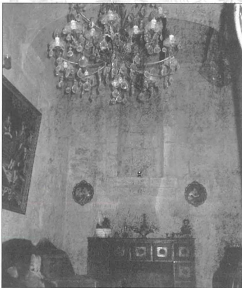
L-intrata lesta mix-xogħol tar-restawr.