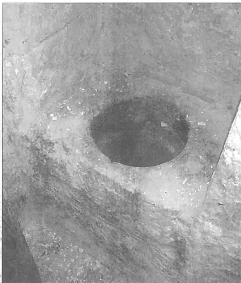
Il-bir li nstab fl-intrata waqt ix-xogħol.

Wara l-miġja tal-Q.T. il-Papa Benedittu XVI, qlajna kamra oħra li kienet lesta fix-xahar ta' Ġunju biex b'hekk issa fadal