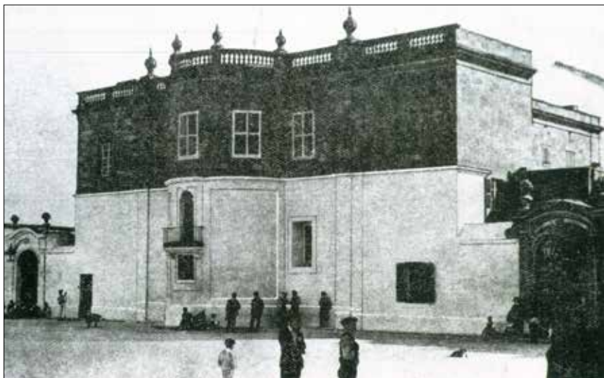
L-Isptar Victoria Lejn l-1930.