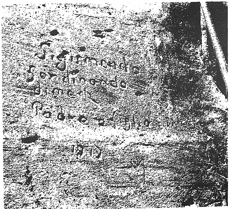
L-VARA TA' ĠESÙ MARIJA