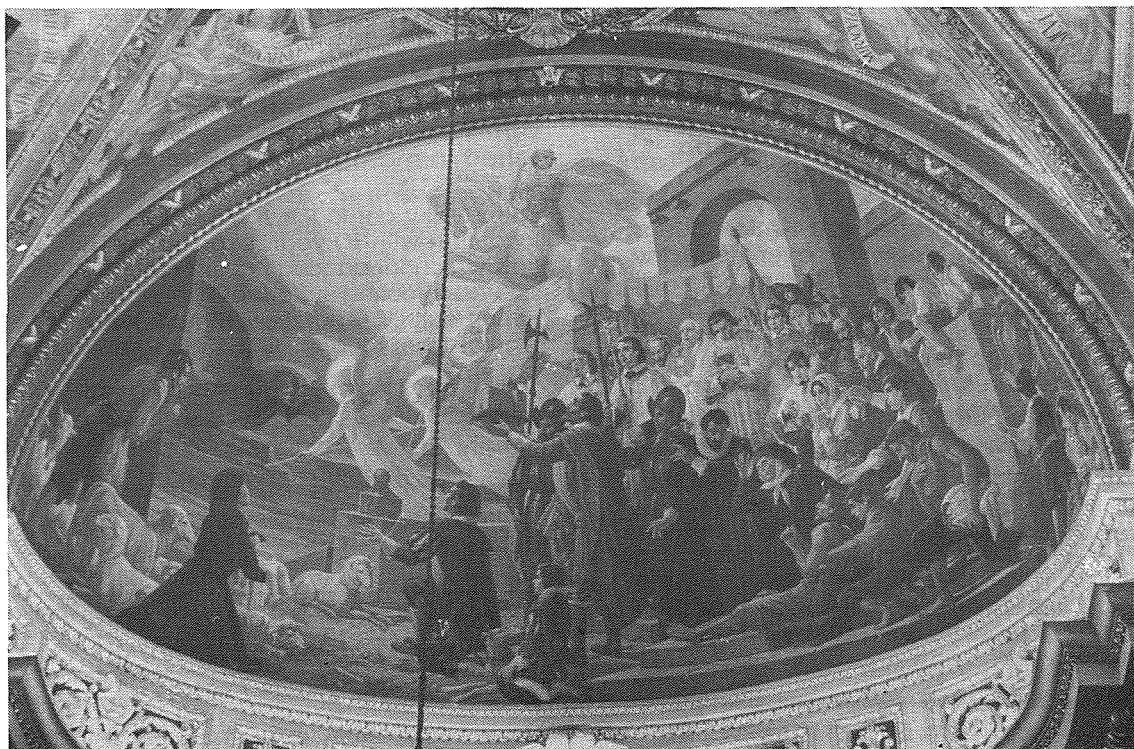
Il-pittura ta' G.B. Conti fil-kappellun tal-erwieħ fil-Bażilika ta' San Ġorġ fir-Rabat ta' Għawdex.

Alfonso V kien laħaq Re ta' Aragona fl-1416