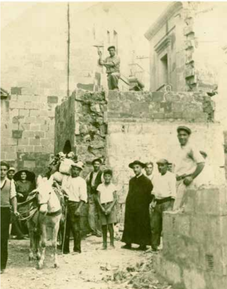
Ritratt li juri l-haddiema fuq ix-xoghol tal-bini tan-nava tal-punent.