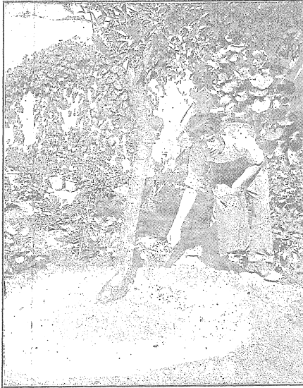
Ohif jintata in-Nitrat ghas-sigiar.

L'abiad ta ma duar is-sigra juri fejn ghandu jigi imxerred in-Nitrat.