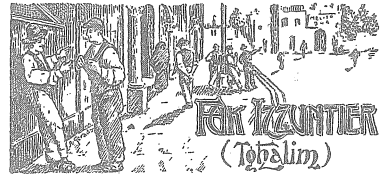
Peppi u Toni