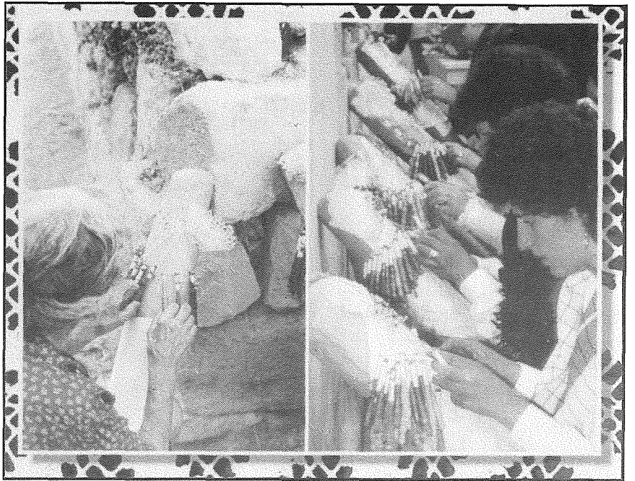
Hajr lil Click - Malta għall-permess tal-publikazzjoni tar-ritratti ta' l-Imġarr u l-bizzilla

Minkejja l-figuri u l-problemi kollha li semmejna, t-turiżmu f'Ghawdex ghandu prospetti sbieħ. Il-prodott qieghed maghna u huwa taghna u jiddependi minna kemm ahna kapaċi nisfruttaw dan il-prodott. Irridu iżda nibżghu ghalih u hemm bżonn li l-partijiet kollha fil-gżira jaghtu l-parti tagħhom fil-qasam turistiku. Kulhadd jidher li huwa koxju mill-importanza tat-turiżmu ghal Ghawdex iżda kemm fil-verita' qed nagħmlu l-parti taghna? Għall-prospetti li ghandu Ghawdex irridu inkunu ahna li b'għemilna u bil-fatti nibdew nikkontribwixxu. Fil-qasam turistku b'mod speċjali fi gżira żghira bħalma huwa Ghawdex ma nistghux nikkommettu żbalji li jkollhom effetti negattivi fuq it-turiżmu. Għalkemm il-proċess tal-progress ma jistax jitwaqqaf, għandna dejjem inkunu ggwidati li l-iżvilupp ikun wiehed bilanċjat u sostenibbli ghal gżira żghira bħalna. Hemm bżonn li ndaħhlu kultura u nibdew miż-żghar taghna li t-turiżmu huwa ta' kulhadd u mhux ta' dawk il-kwazi elf haddiem li jiddependu direttament mit-turiżmu. Barra minn hekk hemm hteġa kbira li l-wirt kulturali taghna għandna nibżghu ghalih u nikkurawh u ma nhallux jinżel f'livell li ma jkunx kapaċi li nirriklamawh. Fl-ahħar mill-ahħar it-turiżmu f'Ghawdex għandu kompetizzjoni sfrenata madwaru u t-turist għandu għażla vasta fejn jista' jqatta' l-vaganza tiegħu. Jekk jagħzilx Ghawdex jiddependi minna lkoll.