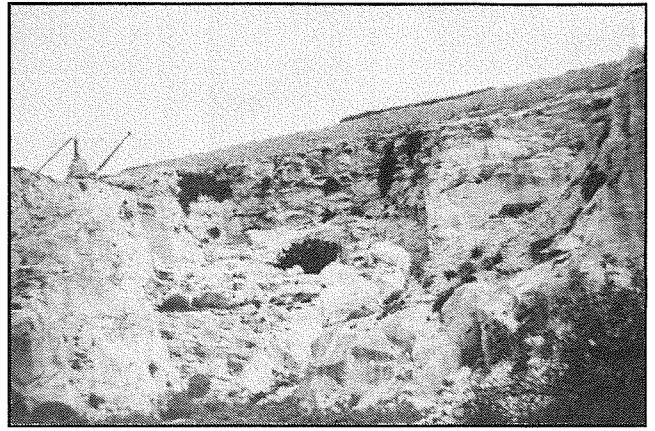
Il-barriera taż-żonqor f'Hondoq ir-Rummien, fil-Qala, mnejn inqata' hafna ġebel għall-monumenti f'pajjiżna.

Niġu issa għall-ahhar saff, dak ta' fuq nett, jiġifieri ż-Żonqor ta' Fuq jew blat tas-samm. Dan il-blat gie li jissejjah ukoll tal-Prima jew Qawwi ta' Fuq għaliex hu mill-aktar iebes. Dan il-blat jinqata' l-aktar biex minnu jagħmlu z-żrar. Barrieri taż-żrar insibuhom fil-Mixta, ix-Xagħra, u n-Nadur. Hawn ta' min ighid li dari z-żrar kien jitkisser bl-idejn, b'martell apposta, xogħol ta' paċenzja kbira. Ġebel iebes taż-Żonqor ta' Fuq jintuża wkoll biex bih isiru l-kurduni tal-bankini, l-ewwel f'it filati tal-bini biex jaqtgħu l-umdità' jew l-indewwa, għetiebi u ċangar ta' l-art. Dan il-ġebel jissejjah ukoll ġebel tal-presepju minhabba l-varjeta' tassew sabiha ta' ġebel li jinqata' minn dan is-saff, l-aktar fejn jithallat mar-Rina, u li minnhom isiru l-presepji tradizzjonali