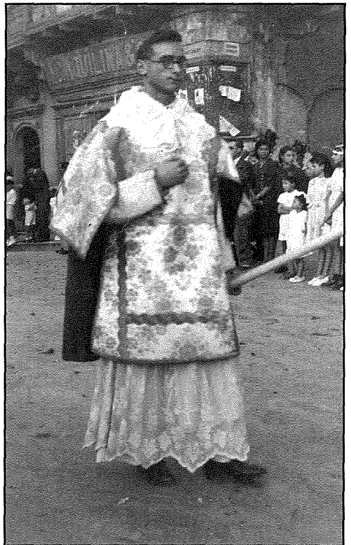
8 ta' Ġunju 1947 fil-Purċissjoni ta' Corpus ġewwa l-Belt meta kien għadu novizz.

Tahtu resaq għall-eżamijiet tal-mużika li swewlu għat-twertieq tal-pastorali. Kien idoqq