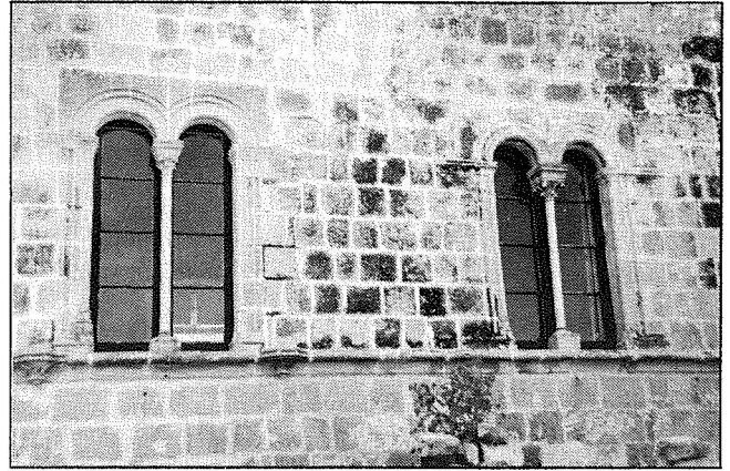
It-twieqi uniċi li jinsabu fil-faċċata tal-Mużew tal-Folklor

Fil-kamra faċċata ta' hawn insibu sistemi differenti ta' wżin. Kif nidhlu fuq il-lemin, imdendla mal-hajt,