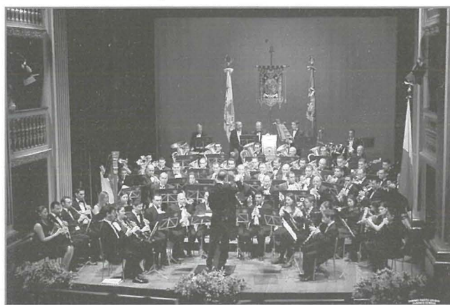
Il-Banda Re Ġorġ V ġewwa t-Teatru Manoel f'Novembru 2005

F'Novembru 2005, il-Banda Re Ġorġ V kienet l-ewwel banda Mqabbija li esegwiet programm strumentali fit-Teatru Manoel, taħt il-patroċinju tal-President ta' Malta, dak iż-żmien Eddie Fenech Adami.