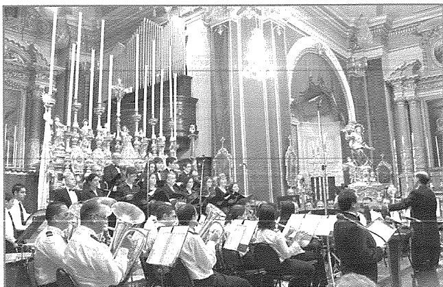
Il-Banda Re Ġorġ V ġewwa l-Knisja Parrokkjali tal-Imqabba waqt l-Akkademja Mużikali fis-sena 2011

U hekk, din il-mixja tal-ewwel soċjetà mużikali Mqabbija tkompli. Telqet mill-bogħod, imma dejjem fl-istess linja kontinwa fl-istess soċjetà: mit-tagħlim tal-