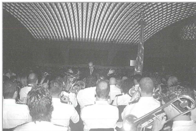
Il-Banda Re Ġorġ V ġewwa s-Sala Nervi fil-Vatikan fis-sena 2007

Il-Banda Re Ġorġ V tellgħet Akkademja Mużikali ġewwa l-knisja parrokkjali ta' Santa Marija fl-okkażjoni tal-Ġublew tad-Deheb tad-Domma tal-Assunta fis-sena 2000.