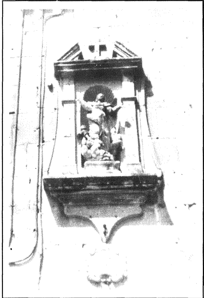
In-Niċċa ta' l-Assunta li tinsab fl-isqaq ma' ġemb tal-Knisja