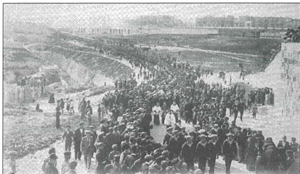
Il-funeral ta' l-Ammirall.

Qabel beda r-riċeviment, imbagħad, sar kunċert mużikali minn pjanisti u kantanti li, dik