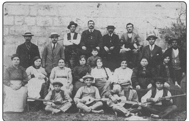
Uħud mill-familja tan-Naxxari, qraba u Maqabbinn oħra. L-ismijiet kollha tan-nies f'dan ir-ritratt ġew ppublikati fil-ktieb Sicut Lilium , paġna 360.