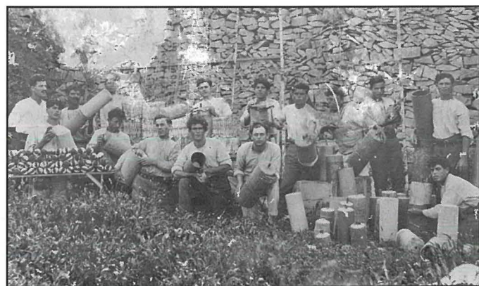
Dilettanti tan-nar tal-Ġilju fil-post tan-nar tagħhom.

mill-Kappillan Dun Paċifiku Mifsud u ndifen fil-qabar numru 42, fil-Knisja Parrokkjali tal-Imqabba. 3