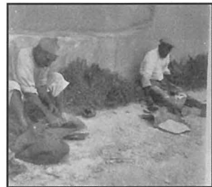
Hafna minn nar kien jinħadem fil-barrieri tal-madwar.

Żewġ okkażjonijiet oħra li ma kinux daqshekk spissi għal irħula rurali bħall-Imqabba kienu żewġ meetings politici li saru fir-raħal mill-Constitutional Party nhar id-29 ta' Marzu 1925 u li fih tkellem Sir Gerald Strickland li kien imexxi l-partit u meeting ieħor mill-Partito Nazionalista fil-5 t'Awwissu 1927. F'dawn il-meetings, minbarra d-diskorsi politici kien ikun hemm għors shiħ ta' bbuwar u interruzzjonijiet mill-popolin u spiss kienet titqassam il-karità lin-nies tal-lokal. Avvenimenti bħal dawn kienu jħawru l-ħajja kultant monotona tan-nies tar-raħal li tinkiser biss kif jaslu l-festi tal-lokal. Hekk kien u hekk għadu sal-ġurnata tal-lum!