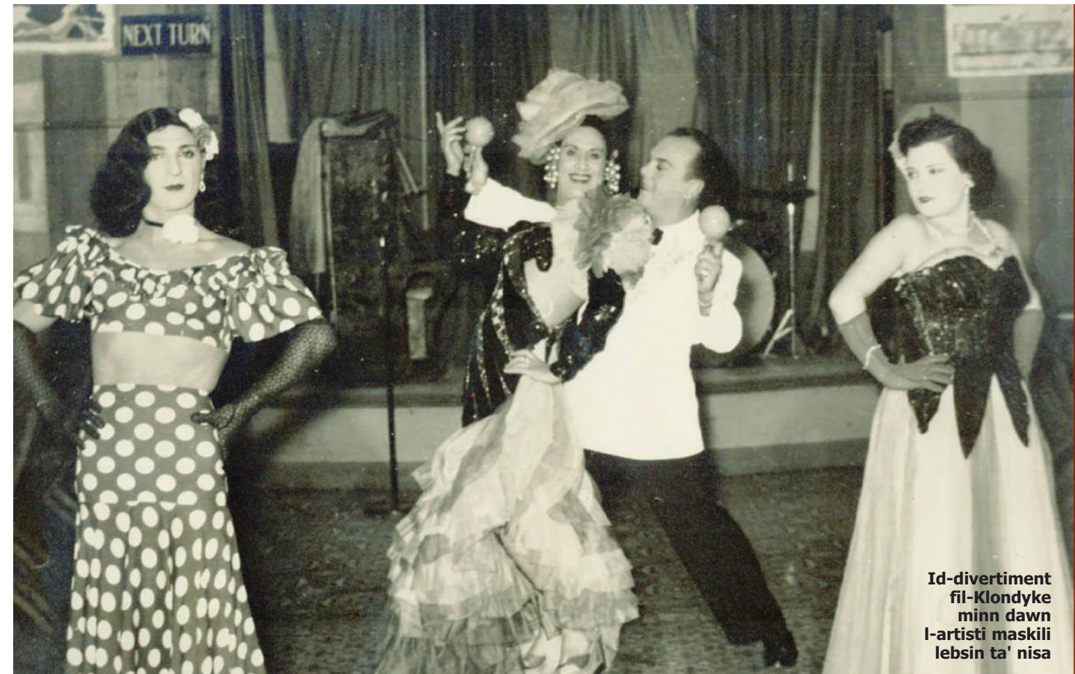
Id-divertiment fil-Klondyke minn dawn l-artisti maskili lebsin ta' nisa