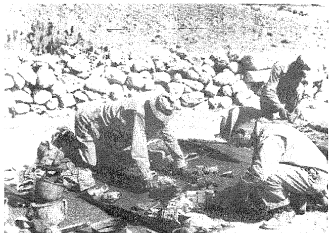
Is-suldati Amerikani f'Għawdex qegħdin jiddiskutu l-“Operation Husky” u f'akkampament tagħhom fl-inħawi ta' l-ajrudrom, Għawdex, Lulju 1943.