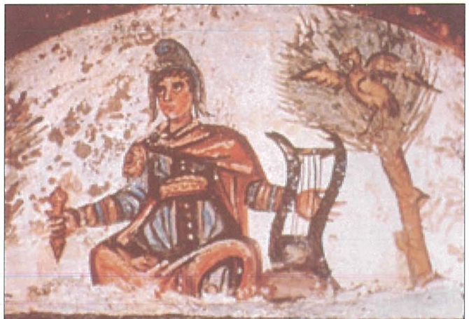
Affresk fil-katakombi ta' San Pietru u Marcellinu f'Ruma li juri lil Kristu fil-forma ta' Orfew. ( https://commons.wikimedia.org/wiki/File:Christ-Orpheus_from_Rome_catacombe.jpg )