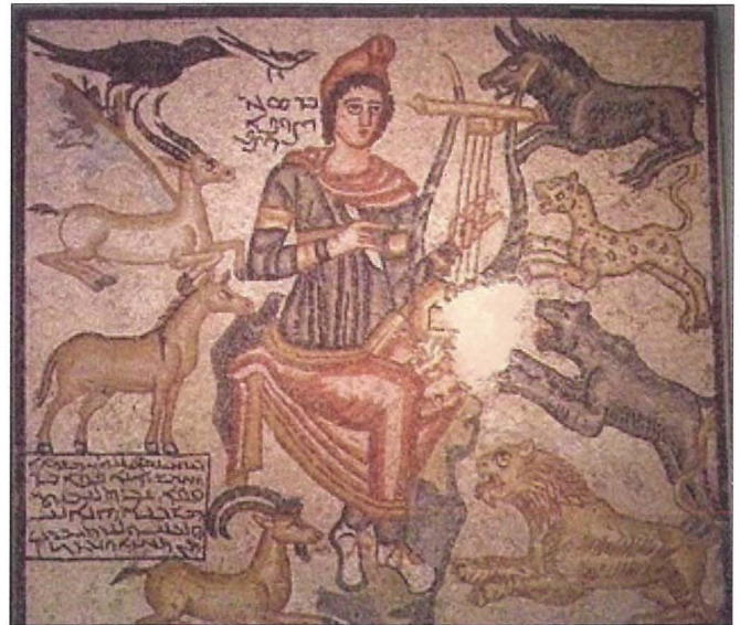
Mużajk Ruman tat-2/3 sekl u W.K. li juri l-alla pagan Orfew jimmansa l-bhejjem slavaġ bid-daqq tal-arpa. (Theoi Greek Mythology http://www.theoi.com/ )

kiex hemm sustanza ta' verità kif ukoll spiritwalità fir-reliġjonijiet pagani antiki. Barra minn dan, l-Ewwel Insara biex ma jinqabdux kienu jużaw l-immagini ta' madwarhom. Hekk insibu li fil-katakombi ta' San Pietru u Marcellinu bdew ipingu lil Kristu fil-figura tal-alla pagan Orfew. Peress li fil-mitoloġija Orfew kien niżel fid-dinja tal-mejtn u tela', l-Ewwel Insara fil-figura ta' Orfew kienu jaraw tixbiha ta' Kristu, li bil-mewt u l-qawmien ħeles lill-bniedem (Yeomans 2014: n p).