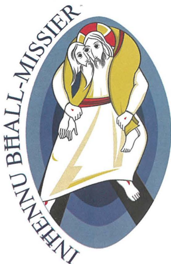
Il-logo uffiċjali tal-Ġublew tal-Ħniena