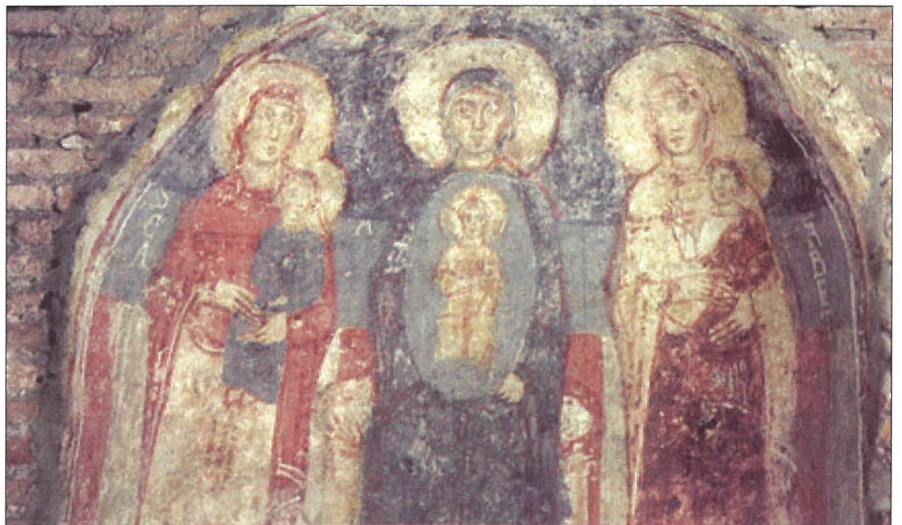
Affresk ta' bejn is-6 u t-8 seklu W.K li juri lil Sant'Anna, lil Madonna u lil Santa Elizabetta lkoll iżommu 'l uliedhom. Dan jinsab f'Santa Maria Anitqua f'Ruma.