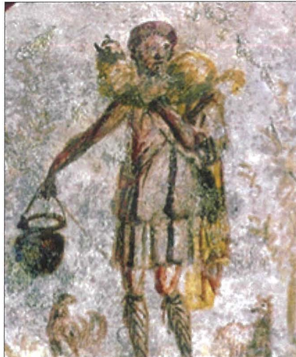
Ir-Ragħaj it-Tajjeb fil-katakombi ta' San Kallistu f'Ruma madwar 200 W.K. ( http://frederica.com/ )

Fil-pittura ta' fuq il-faccata, Sant'Anna u bintha Marija jidhru nies tal-lum. Fil-fatt il-mantell aħdar mhuwa xejn għajr xalla li tilbes mara llum il-ġurnata. Din saret bi ħsieb, għaliex il-preżenza ta' ommna Marija u binha Ġesù għadha attwali u għal min jemmen, isib li huma preżenti fir-realtajiet iebes tal-lum.